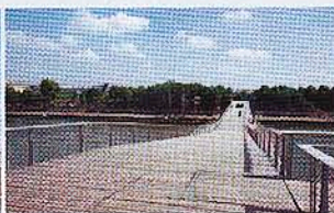
セーヌ川もまた違った印象。開放感あるさわやかなエリア

再開発が進むベルシー地区は、新しいパリの景色に出合えるエリア。散策にもおすすめ。