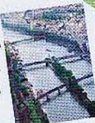
360度の大パノラマは必見!