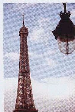
さまざまな角度からエッフェル塔を楽しもう